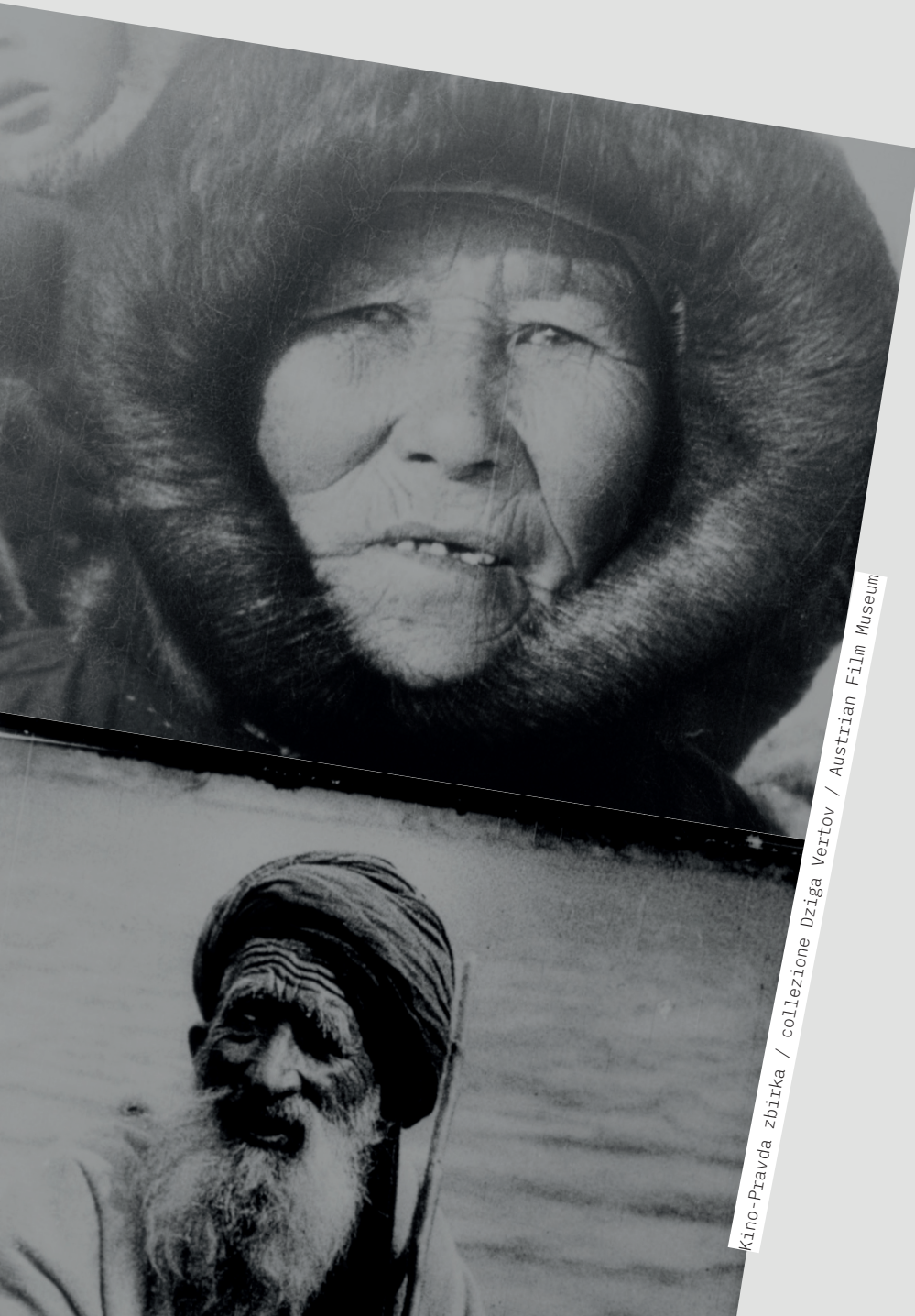
Kino-Pravda zbirka / collezione Dziga Vertov / Austrian Film Museum

Med letoma 1922 in 1925 je precej neredno in v malo izvodih izhajala serija obzornikov Dzige Vertova, ki nosi naslov »Kino-Pravda« (Kino-resnica) in jo sestavlja 23 delov. Vertov je s to serijo obzornikov želel ustvariti nekakšen »časopis za zaslone«, naslov pa je poklon časopisu »Pravda«, ki ga je ustanovil Lenin. Tako serija obzornikov »Kinonedelja« (1918–1919) kot tudi »Kino-Pravda« ponujajo zanimiv vpogled v zgodnje obdobje Sovjetske zveze in dokazujejo hiter razvoj Vertovega filmskega jezika. Med letoma 2017 in 2018 je Avstrijski filmski muzej 22 ohranjenih števil (št. 12 je izgubljena) digitaliziral in podnaslovil v nemščini ter angleščini, od leta 2018 pa so te na voljo na spletu. / Tra il 1922 e il 1925 apparvero in totale, anche se in modo irregolare e in pochissime copie, 23 numeri della serie di cinegiornali »Kino-Pravda« (Cine-Verità) di Dziga Vertov. L'obiettivo di Vertov era quello di creare una sorta di »giornale per lo schermo« il cui titolo era un omaggio al quotidiano »Pravda« (Verità) fondato da Lenin. Proprio come la serie di cinegiornali »Kinonedelja« (1918–1919), i numeri di »Kino-Pravda« offrono un'affascinante panoramica del primo periodo dell'Unione Sovietica e dimostrano il rapido sviluppo del