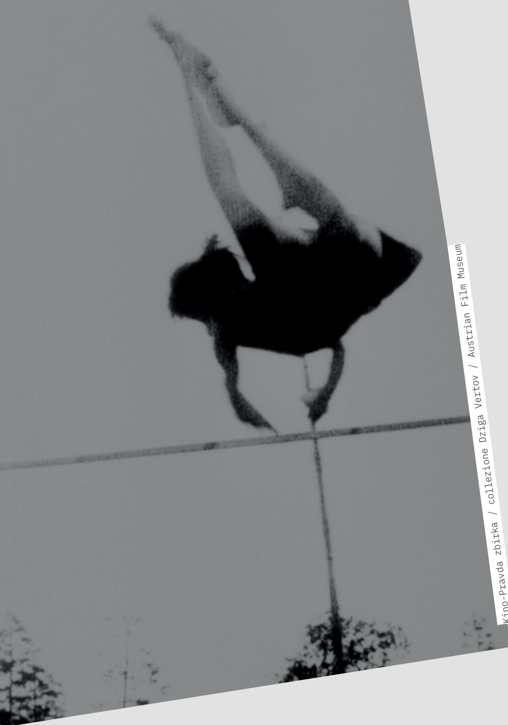
Kino-Pravda zbirka / collezione Dziga Vertov / Austrian Film Museum

linguaggio cinematografico di Vertov. 22 numeri della serie (il n. 12 è perduto) sono stati digitalizzati e sottotitolati in tedesco e inglese dall'Austrian Film Museum tra il 2017 e il 2018 e da allora sono disponibili online.